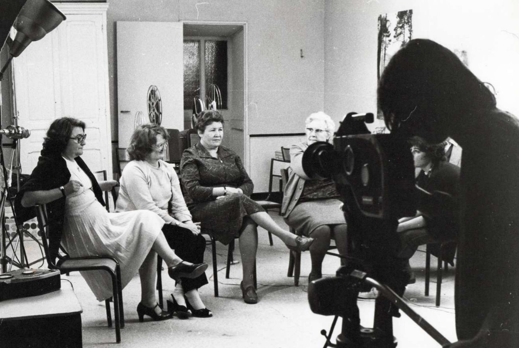
Femmes de mineurs, un film de Marie-José Aïassa & Valérie Deschênes