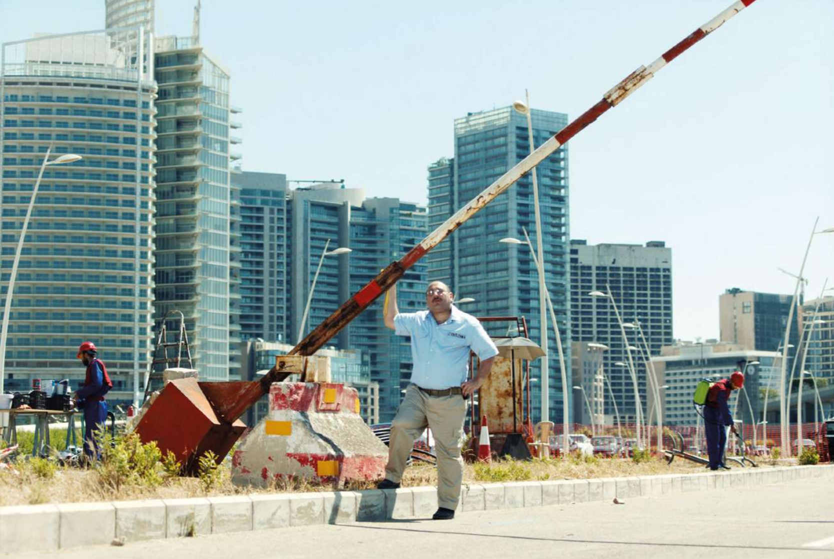
Et si le soleil plongeait dans l'océan des nues, un film de Wissam Charaf