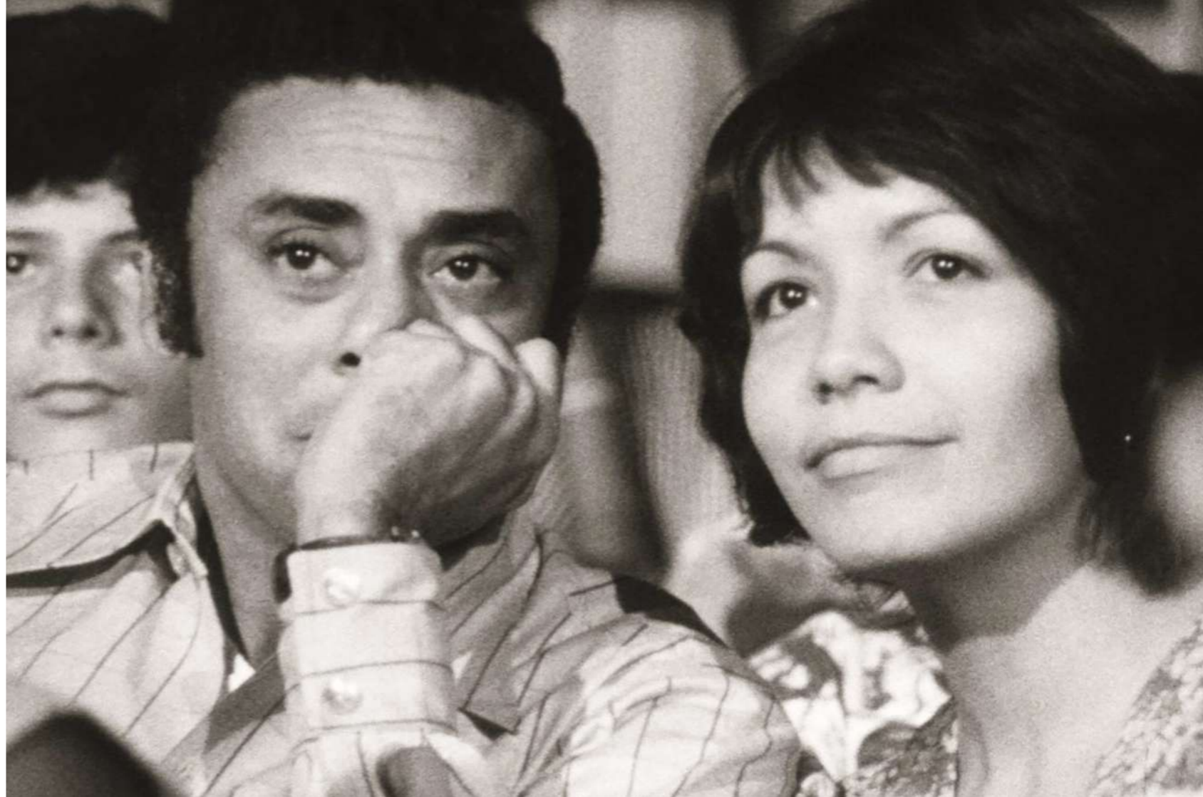
De cierta manera, un film de Sara Gómez