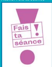
Atelier Photonière ©Sybille Duboc