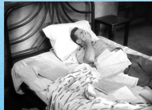
Sunset Boulevard de Billy Wilder, 1950