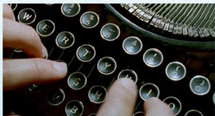
Barton Fink de Joel & Ethan Coen, 1991